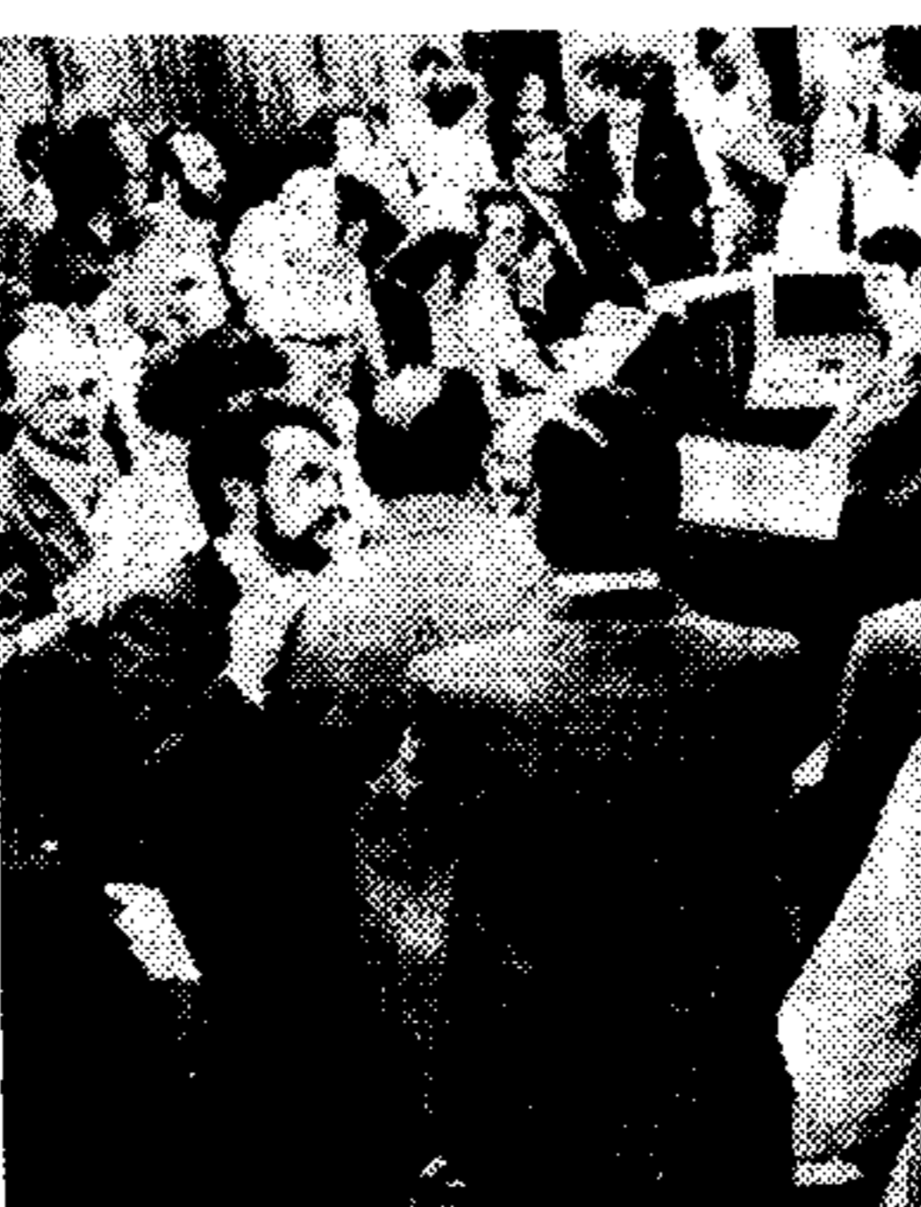
Μεγάλη καί ζοφερή συγκέντρωση χῆς στήν Χρηματαγορά τῶν Παρισίων. Τό δολλῆριο παραμένει κῶν ἐπῆ τῶν ἰσορροπιῶν στίς ἀναλλαγές.

Ζητοῦν παρέμβαση Ὑπάρχουν πληροφορίες, ὅτι οἱ διεθνῶν τῶν Κεντρικῶν Τραπεζῶν, πού συνήλθαν τῶ Σαββατοκύριακο